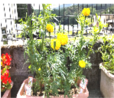
さくらが丘集会所