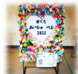
宿毛高校地域貢献部の生徒さんによる手作り看板