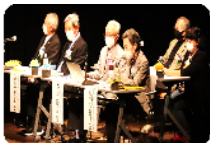
市内5団体による活動報告