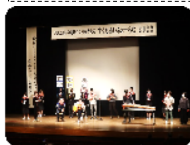
音楽隊による演奏