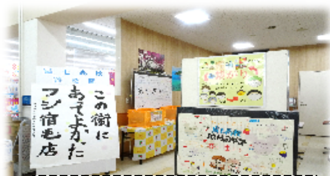
食料品寄付ボックス設置の様子