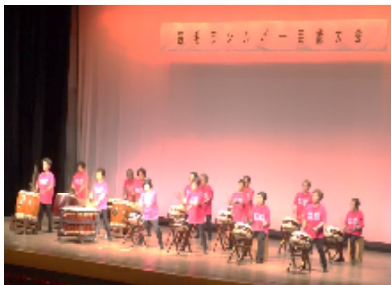
宿毛市シルバー芸能大会優秀賞 は次の通りです。（敬称略）