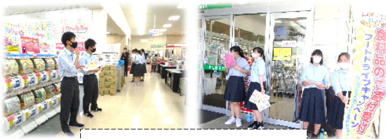
宿毛高校地域貢献部の皆さんの活躍の様子