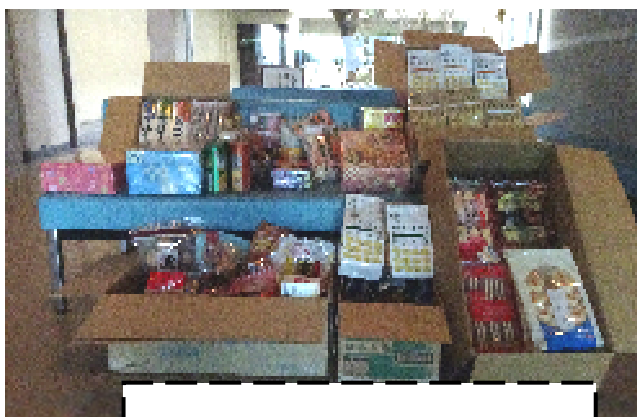
旭食品宿毛支店様より