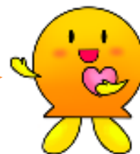
宿毛市社会福祉協議会 キャラクター だるも

社会福祉協議会では、「誰もが安心して暮らせる地域社会」の実現を目指して、次のような事業を行っています。