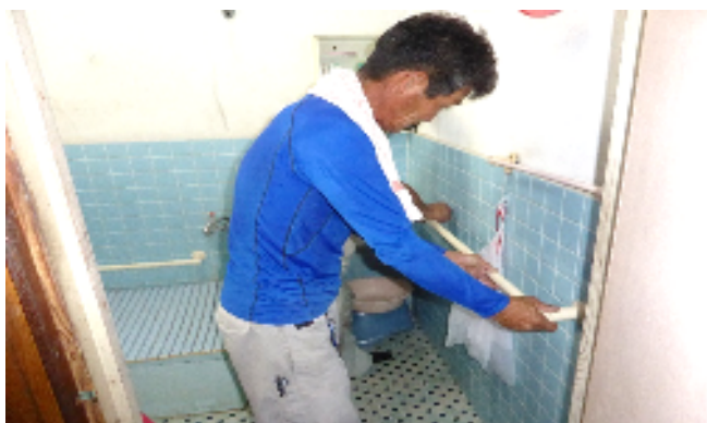
昨年の改修作業風景

高知県建設労働組合宿毛支部では、毎年夏休み中に奉仕活動の一環で行う「住宅デー」の関連行事として、7月29日（日）に親子木工教室を開催し、あわせて7月22日（日）・29日（日）に高齢者世帯等の、家屋等の補修を材料費のみの実費で行う予定です。 つきましては、各区の75歳以上の一人暮らしや高齢者世帯の方で「手すりを付けたい」、「雨戸を直したい」など簡易な補修が必要の方がおられましたら、社会福祉協議会または担当地区の民生児童委員までお知らせください。 なお、材料の準備や下見が必要なため、申し込みは6月29日（金）までお願いいたします。